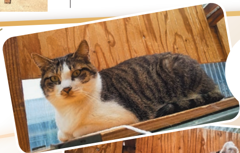
3歳の子ビ、お兄ちゃん