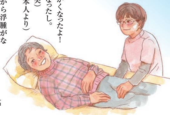
T様 安曇野市穂高 87歳女性