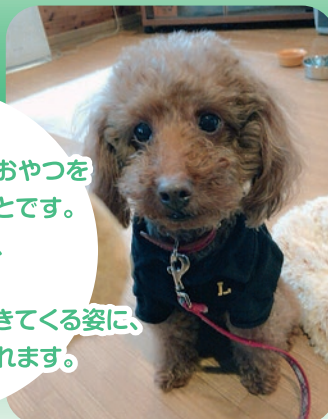
ココちゃん 7歳 オストイブードル

特技は、 隠してあるおやつを探し出すことです。 帰宅すると、玄関までかけよってきてくれる姿に、とても癒されます。