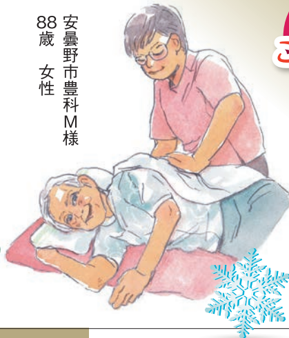
安曇野市豊科M様 88歳 女性

ご本人より 「マッサージをして頂きな がら楽しくお話しをして いると時間があっという 間に過ぎてしまいます。 来て下さるのをいつも楽 しみにしています。」